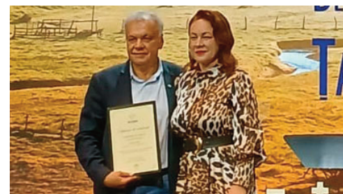
Compania de presă Accent Media, premiată la Gala Destinației Ecoturistice Țara Hațegului. /pag.16

ANUL XXI • NR. 961 • APARE 29 MAI - 4 IUNIE 2026 • 16 PAGINI • 4 LEI • www.accentmedia.ro