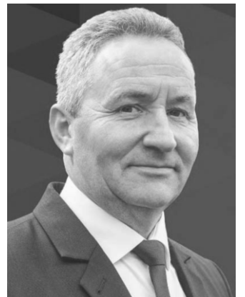
Cupa Offroad Mania.

- Organizarea Festivalului „Istorie, Natură, Cultură” de la Costești; organizarea Festivalului de Reconstituire istorică „Frăția lupilor”; Festivalul „Țurcana - Regina Munților” pentru crescătorii de animale din comună și din zonă; „Nunta de aur” - serbarea și premiarea cuplurilor din comună care au împlinit 50 de ani de căsnicie; Hard Enduro Arsenal Costești;