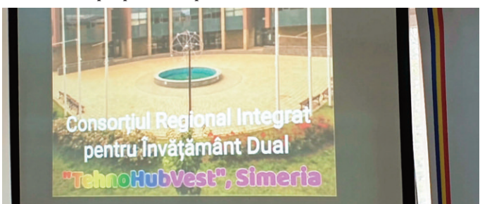
Consortiul Regional Integrat pentru Învățământ Dual "TehnoHubVest", Simeria