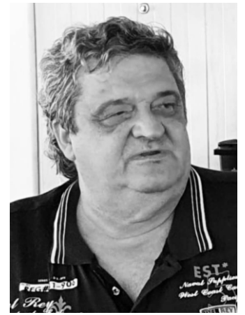
tiparniței sale și s-a văzut limpede cât de bine i-a mers strategia.

Mulți sunt tentați să spună că problema datoriilor americane nu e una așa mare deoarece ei își tipăresc banul, deci oricând pot schimba regula jocului. Aiurea, e o iluzie! Și alții erau stăpâni